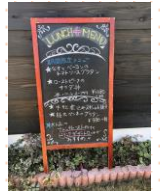
ランチのおすすめメニュー