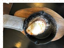
フレンチトーストの上には濃厚なバニラアイス。味と食感のコンビネーションは抜群