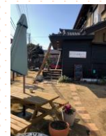
古民家を改造した店です。テラスもある。

「オーブン+」鎌ヶ谷東初富5-7-26 TEL 050-5223-3735 予約可 営業時間：11:00~16:00 18:00~22:00 カフェタイム 13:00-16:00 定休日：水曜(祝日、祝日前日は営業) 席数 16 駐車場：あり