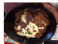
牛すじ煮込みのスキレット焼き980円